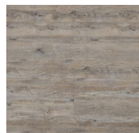
003 - KW 6022