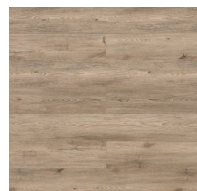
004 - KW 6053