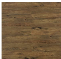
001 - KBW 8611